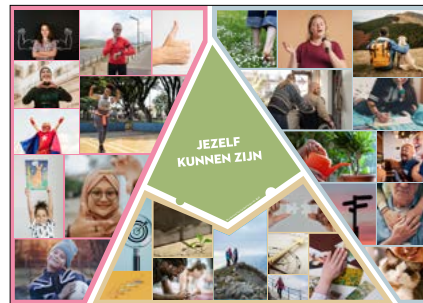
Vertelplaat 'Jezelf kunnen zijn'