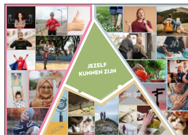
Vertelplaat 'Jezelf kunnen zijn'