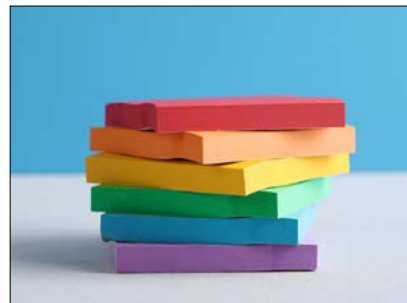
Post-its in verschillende kleuren (in strookjes van 3 te knippen, +/- 5 strookjes per deelnemer)