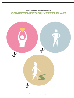
3 ronde vertelschijven (uit te knippen) met symbooltjes geluksdriehoek