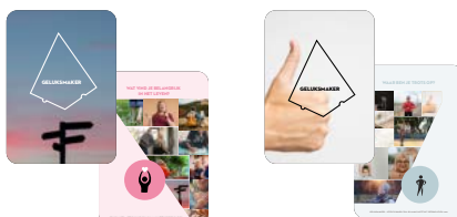
Gelukskaarten 'jezelf kunnen zijn'