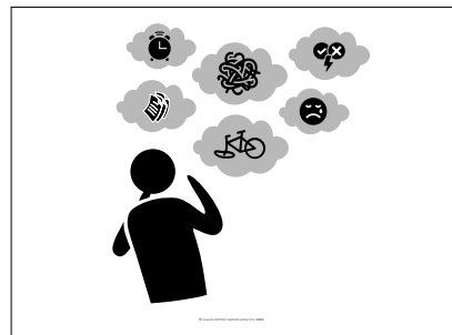
Vertelplaat 'Zorgen & jezelf kunnen zijn'