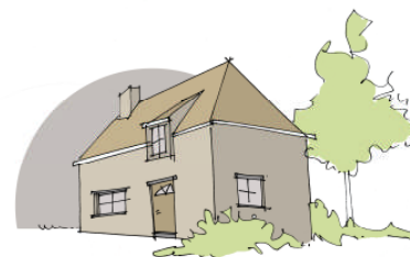
Recht op behoorlijke huisvesting